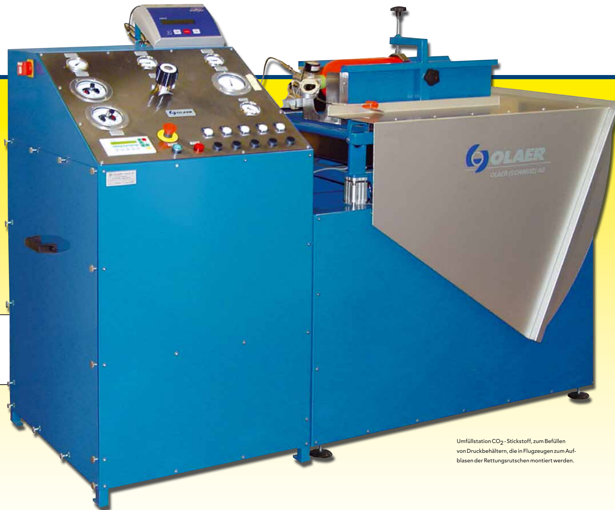
Umfüllstation CO 2 -Stickstoff, zum Befüllen von Druckbehältern, die in Flugzeugen zum Aufblasen der Rettungsutschen montiert werden.