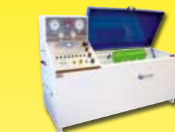
Umfüllstation Medizinalsauerstoff, zum Befüllen von verschiedenen Sauerstoffflaschen, die in Flugzeugen montiert werden.