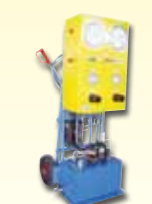
Mobile Druckeinheit 3000 bar, als Druckquelle zum Abpressen von Eisenbahn-Rollmaterial.