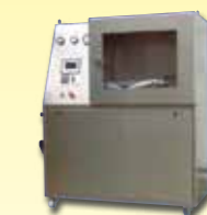
Berstdruck Prüfstand für Feuerwehrschräume 0 - 50 bar