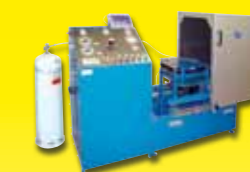
Umfüllstation Halon - Stickstoff, zum Befüllen von Feuerlöschern.

Druckbehälter sind in allen Formen, Grössen und Zulassungen ebenfalls bei OLAER erhältlich.