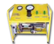
Tragbares Umfüllsystem zum Befüllen von Hydraulikspeichern mit Stickstoff, für Vorfülldrücke bis 600 bar.