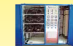
Gaskompressorsystem mit drei verschiedenen Druckstufen 12 bar - 40 bar - 120 bar, als Hochdrucknetzversorgung für einen Produktionsbetrieb.