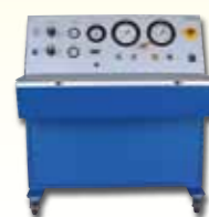
Impulsprüfstand 2500 bar für die Ermittlung der Lebensdauer von Näherungsschaltern.