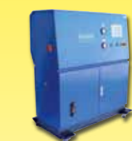
Druckeinheit 1200 bar, zum Abgleichen von Drucktransmitern.